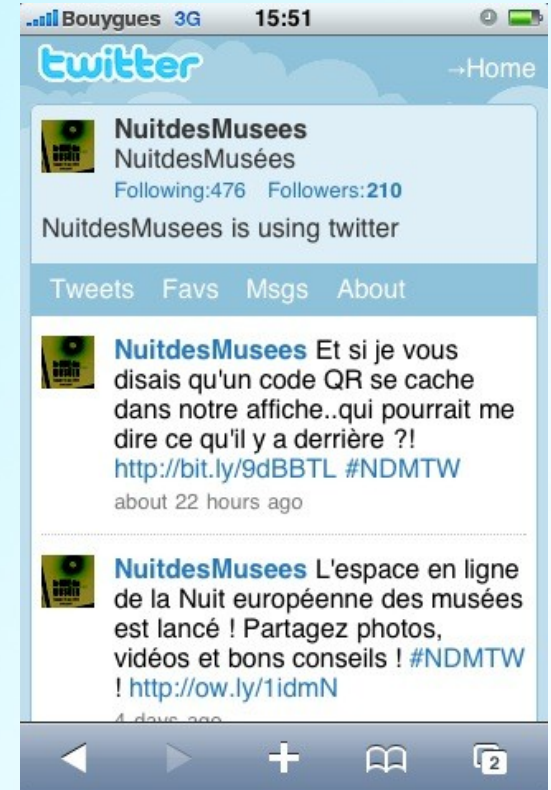
Vue sur smartphone