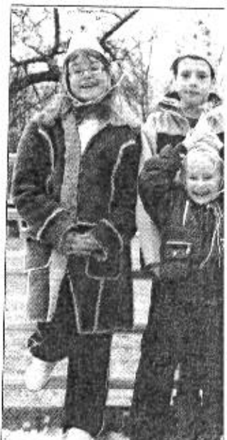
Tous fiers de porter des cha-

Les enfants de Reppe se sont retrouvés samedi pour une après-midi récréative. Après avoir confectionné un chapeau en papier et ra- fia, ils ont dégusté des bei- gnets, cuisinés spéciale- ment pour l'occasion par Pascal Viennot. De 3 à 12 ans, les enfants